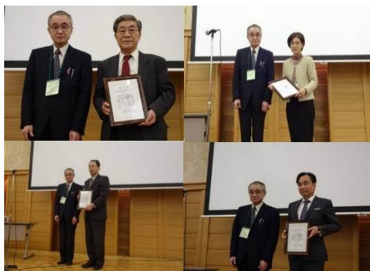
第1回認証事業者(4社)への認証書交付

中小企業にも活用可能な低コスト・短時間で食品機能性を表示できる四国健康支援食品制度(ヘルシー・フォー)の創設に参画し、平成29年6月に全国初の民間運用で開始した。運用開始後は、申請する企業の支援を行って、認証食品の創出へと導くことができた。その後、も販路開拓へ向けて展示会やフォーラムに出展等を行っている。