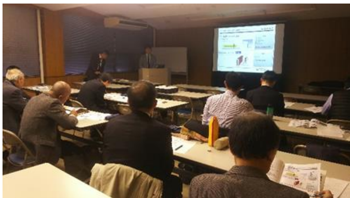
マッチングに向けたブラッシュアップ作業

企業の最重要課題である販路開拓のニーズに応えるため、今年度も関西圏企業とのマッチングを行った。4県の企業20社にそれぞれ担当コーディネーターを配置し、自社の強みを知り独自技術や事業化シーズを効果的にPRできるよう準備を行い、企業の「技術を売る」取り組みについてお手伝いを行った。また並行して、支援要望をいただいた企業にコーディネーターを派遣し、技術開発など個別の対応も行っている。