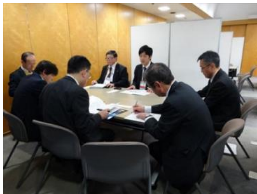
ビジネスマッチングにおける商談会